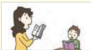
따라하세요. សូមប៉ានតាម។