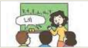
네, 질문 있습니다. បាទ/ចា, ខ្ញុំមានសំណួរ។