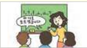
아니요, 모르겠습니다. អត់ទេ, ខ្ញុំមិនយល់ទេ។