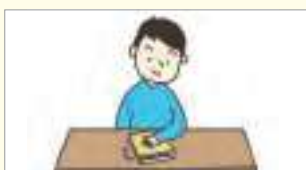
책을 덮으세요. សូមបិទសៀវភៅ។