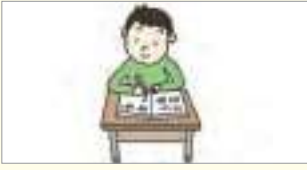
쓰세요. សូមសរសេរ។