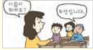
대답하세요. សូមឆ្លើយ។