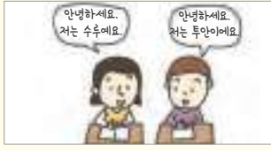
이야기하세요. សូមនិយាយ។