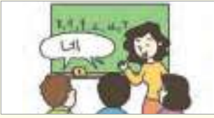
네, 알겠습니다. បាទ/ចា, ខ្ញុំយល់ហើយ។