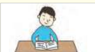
책을 펴세요. សូមបើកសៀវភៅ។

តើអ្នកគ្រូ/លោកគ្រូនៅក្នុងថ្នាក់ឧស្សាហ៍និយាយអំពីអ្វីខ្លះ? សូមស្វែងរកពាក្យឬកន្សោមពាក្យដែលឧស្សាហ៍ប្រើប្រាស់នៅក្នុងថ្នាក់រៀន។