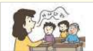
들으세요. សូមស្តាប់។