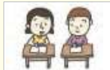
반 친구 មិត្តរួមថ្នាក់