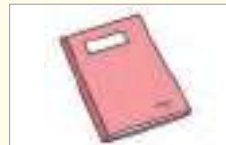
공책 សៀវភៅសរសេរ