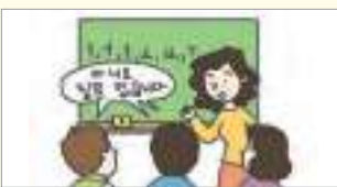
아니요, 질문 없습니다. អត់ទេ, ខ្ញុំមិនមានសំណួរអ្វីទេ។