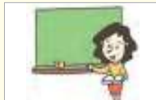
선생님 លោកគ្រូ/អ្នកគ្រូ

តើនរណានៅក្នុងថ្នាក់រៀន? តើអ្នកឃើញអ្វីខ្លះនៅក្នុងថ្នាក់រៀន?