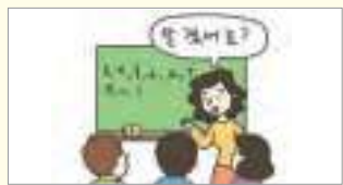
알겠어요? តើយល់ហើយរឺនៅ?