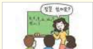
질문 있어요? តើមានសំណួរដែររឺទេ?