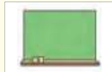
칠판 ក្តាររៀន