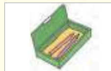
필통 ប្រអប់ប៊ិក