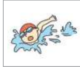
수영하다 to swim