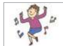
춤을 추다 to dance