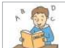
외국어를 배우다 to learn foreign languages