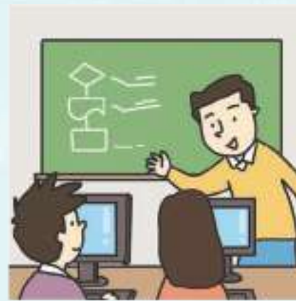
컴퓨터 수업 Computer lesson