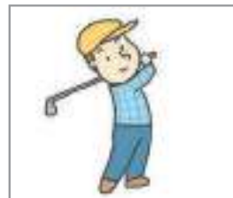
골프를 치다 to play golf