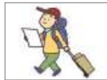
여행하다 to travel