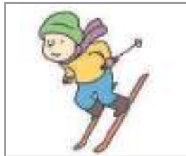
스키를 타다 to ski