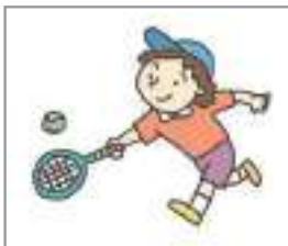
테니스를 치다 to play tennis