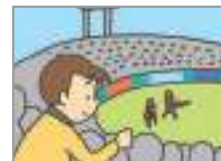
운동 경기를 보다 to watch sports games