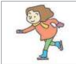
스케이트를 타다 to skate