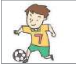
축구하다 to play soccer