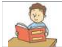
독서하다 to read

The following are expressions related to various hobbies. Let`s learn together.