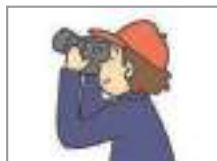
사진을 찍다 to take pictures