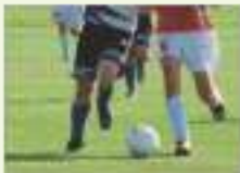
축구 동호회 soccer club

같은 취미를 가진 사람들이 취미 활동을 같이 하는 모임입니다. There are clubs for those who enjoy shared hobbies and interests.