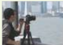
사진 동호회 photography club