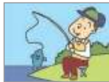
낚시하다 to go fishing