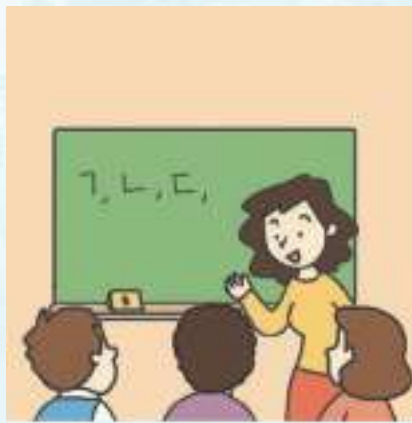
한국어 수업 Korean lesson

Community centers, Global Migrant Centers, Korean Support Centers for Foreign Workers, and Supporting Multicultural Households Center (Danuri) offer various educational programs including Korean language education, computer lessons, and taekwondo lessons, so that foreigners can enjoy a better life in Korea.