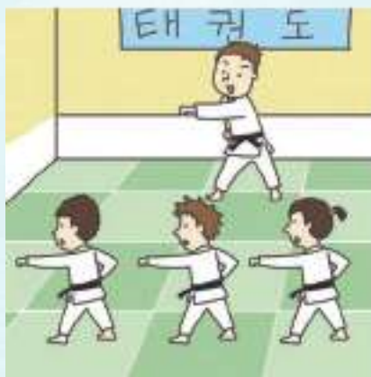
태권도 수업 Taekwondo class