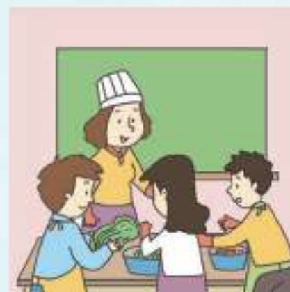
요리 수업 Cooking lesson