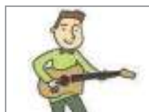
기타를 치다 to play guitar