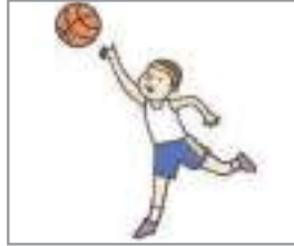
농구하다 to play basketball