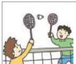
배드민턴을 치다 to play badminton