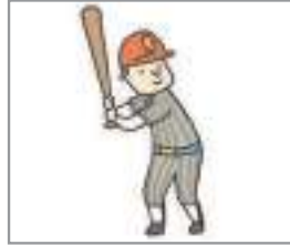
야구하다 to play baseball