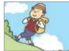
등산하다 to hike