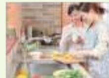
요리 동호회 cooking club