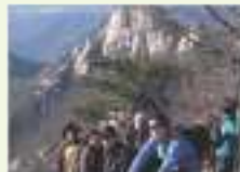
등산 동호회 hiking club