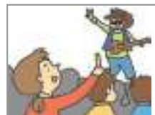
콘서트를 보다 to go for a concert