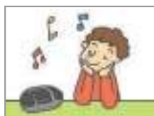
음악을 듣다 to listen to music