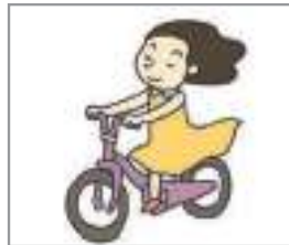
자전거를 타다 to ride a bike