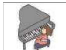
피아노를 치다 to play the piano