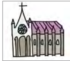
성당 gereja katolik