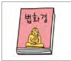
불경 tripitaka/kتاب Buddha