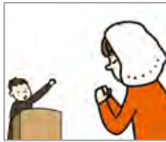
미사를 드리다 sembahyang misa