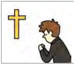
예배를 드리다 beribadah/berdoa (Katolik/Kristen/Islam)