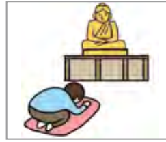
예물을 드리다 memberikan penghormatan