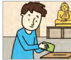
불전/헌금을 내다 mengisi kotak sedekah