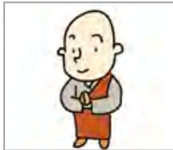
스님 biksu/pendeta Buddha