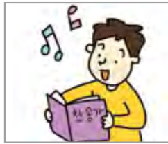
찬불가/성가를 부르다 menyanyikan lagu Buddah /Kidung Pujian (gerja)