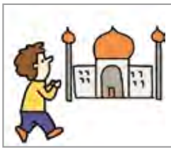
성지 순례를 가다 berhaji/naik haji