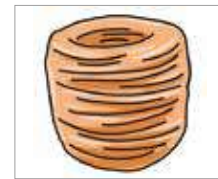
비닐 끈 tali rafia

Kerjakan soal berikut tanpa melihat kosakata yang dipelajari.