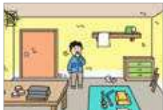
냄새가 심하다 baunya menyengat