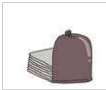
마대 karung goni