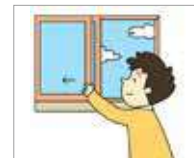
환기하다 mengalirkan udara

Kerjakan soal berikut tanpa melihat kosakata di atas.