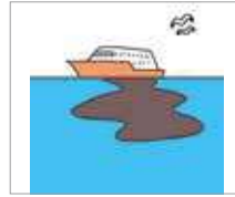
폐유 limbah minyak