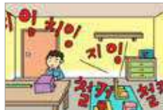
소음이 심하다 tingkat kebisingannya parah