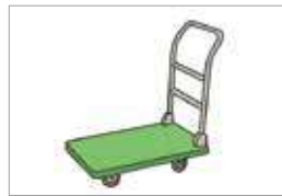
손수레 troli barang