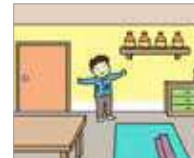
정리가 잘 되어 있다 rapi