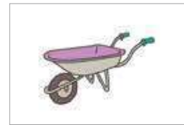
일륜차 gerobak celeng