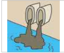
폐수 limbah cair