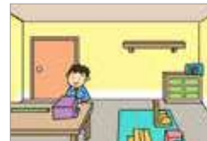
쾌적하다 rapi dan nyaman