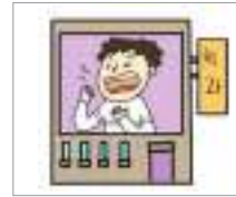
ຈຽງ ພະແນກປິວແຂ້ວ