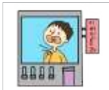
ນາວ ພະແນກຫຸຕາດັງຄໍ