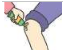
연고를 바르다 ທາຢາ