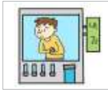
ນາວ ພະແນກພາຍໃນ

ລອງມາເບິ່ງວ່າຄຳສັບທີ່ກ່ຽວຂ້ອງກັບໂຮງໝໍມີຫຍັງແດ່.