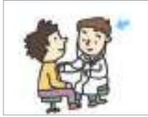
치료를 하다 ເຮັດການປິ່ນປົວຮັກສາ

ລອງມາເບິ່ງວ່າຄຳສັບທີ່ກ່ຽວຂ້ອງກັບການປິ່ນປົວຮັກສາມີຫຍັງແດ່?