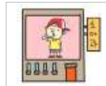
ນາວ ພະແນກພະຍາດເດັກນ້ອຍ