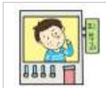
ນາວ ພະແນກຜິວໜັງ