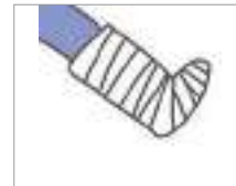
깁스를 하다 ໃສ່ເຜືອກຜ້າ