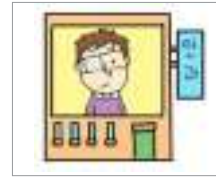
ນາວ ພະແນກປິວຕາ