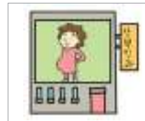
ນາວ ພະແນກພະຍາດຍິງ