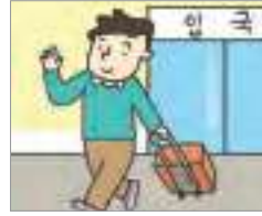
재입국하다 ເຂົ້າປະເທດ ຄືນໃໝ່