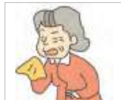
편찮으시다 ບໍ່ສະບາຍ