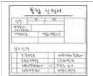
재입국 허가 신청서 ຝອມສະໝັກ ເຂົ້າປະເທດຄືນໃໝ່