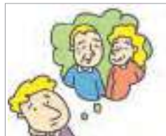
집안 사정 ກໍລະນີ ຂອງຄອບຄົວ