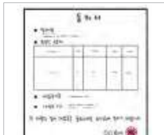
동의서(허가서) ຝອມອະນຸຍາດ