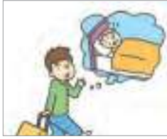
조기 귀국하다 ກັບຄືນປະເທດ ກ່ອນກຳນົດ

ຖ້າຫາກຕ້ອງການອອກຈາກ ປະເທດຊົ່ວຄາວ ດ້ວຍເຫດຜົນສ່ວນຕົວໃດໜຶ່ງ ແມ່ນເຮັດແນວໃດ? ລອງ ກວດກາເບິ່ງຄຳສັບ ທີ່ກ່ຽວຂ້ອງກັບການກັບຄືນປະເທດ ກ່ອນກຳນົດ ແລະ ການອອກຈາກປະເທດຊົ່ວ ຄາວເບິ່ງບໍ?