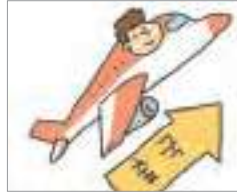
일시 출국하다 ອອກຈາກປະເທດ ຊົ່ວຄາວ