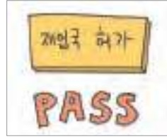
면제되다 ຍົກເວັ້ນ