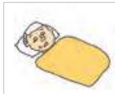
병환 ການເຈັບເປັນ