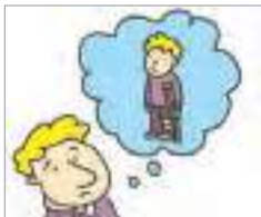
개인 사정 ກໍລະນີ ສ່ວນຕົວ